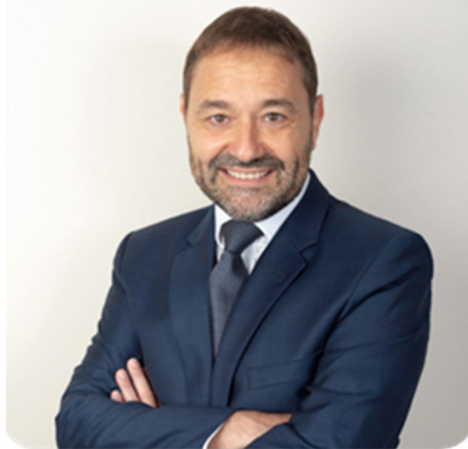
Fondateur de Next Momentum

Directeur pédagogique Référent de l'équipe de formateurs Market Technical Strategist